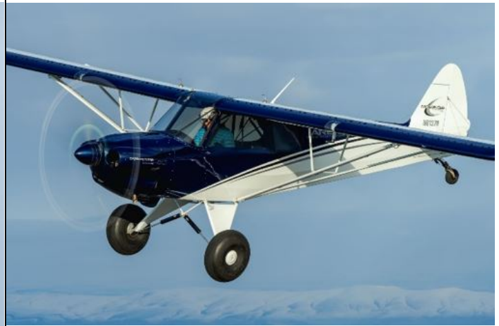
Il nuovo Carbon Cub UL con motore Rotax 916iS/c di CubCrafters

Lakeland (Florida), 28 marzo 2023 – BRP-Rotax, una società controllata di BRP Inc. (TSX:DOO; NASDAQ:DOOO), è orgogliosa di raggiungere un nuovo livello di prestazioni con il lancio del suo motore aeronautico Rotax 916iS/c, che lo rende perfettamente adatto agli aerei a quattro posti e a quelli a due posti ad alte prestazioni. Con un peso di 85,8 chilogrammi e una potenza di 160 CV, il 916iS/c offre un rapporto potenza-peso senza precedenti nel settore degli aerei leggeri ed è disponibile con una fantastica versione a 24 volt per maggiori funzionalità e comfort nella cabina di pilotaggio. Il Rotax 916iS/c ha fatto il suo debutto oggi al SUN 'n FUN Aerospace Expo di Lakeland, in Florida, esibendo la sua potenza per la prima volta in un aereo CubCrafters, un nuovo cliente di BRP-Rotax.